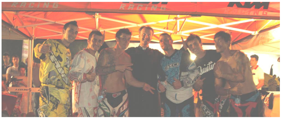
I "Daboot Airlines" dopo il primo spettacolo di Sabato sera al Motor Party