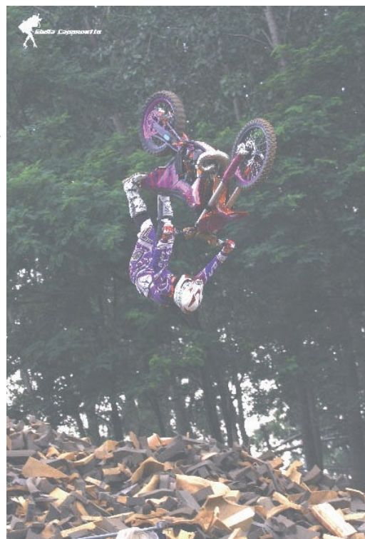
Questo sono proprio io!